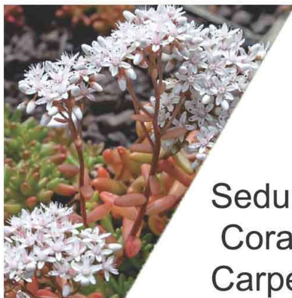
Sedum Coral Carpet