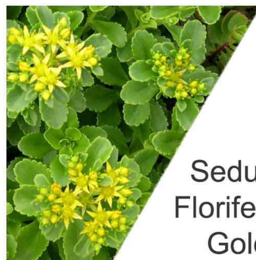
Sedum Floriferum Gold