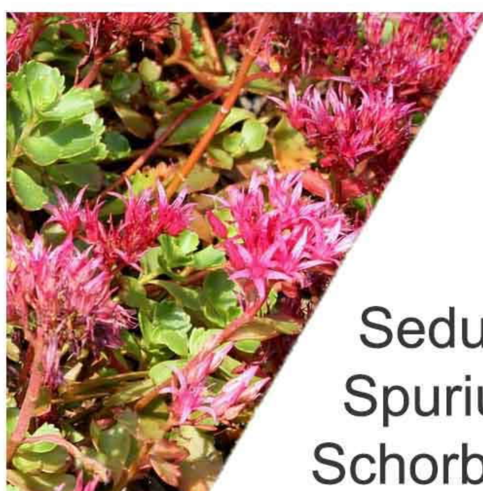
Sedum Spurium Schorbuser