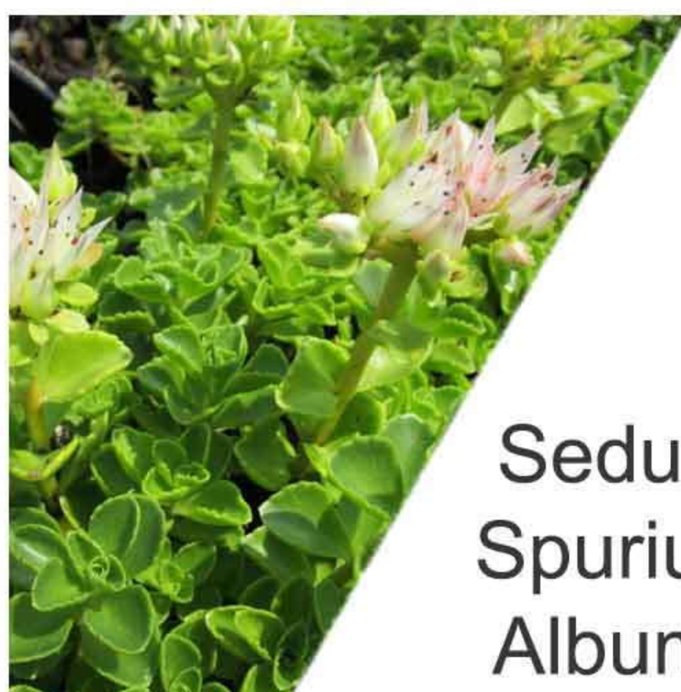
Sedum Spurium Album