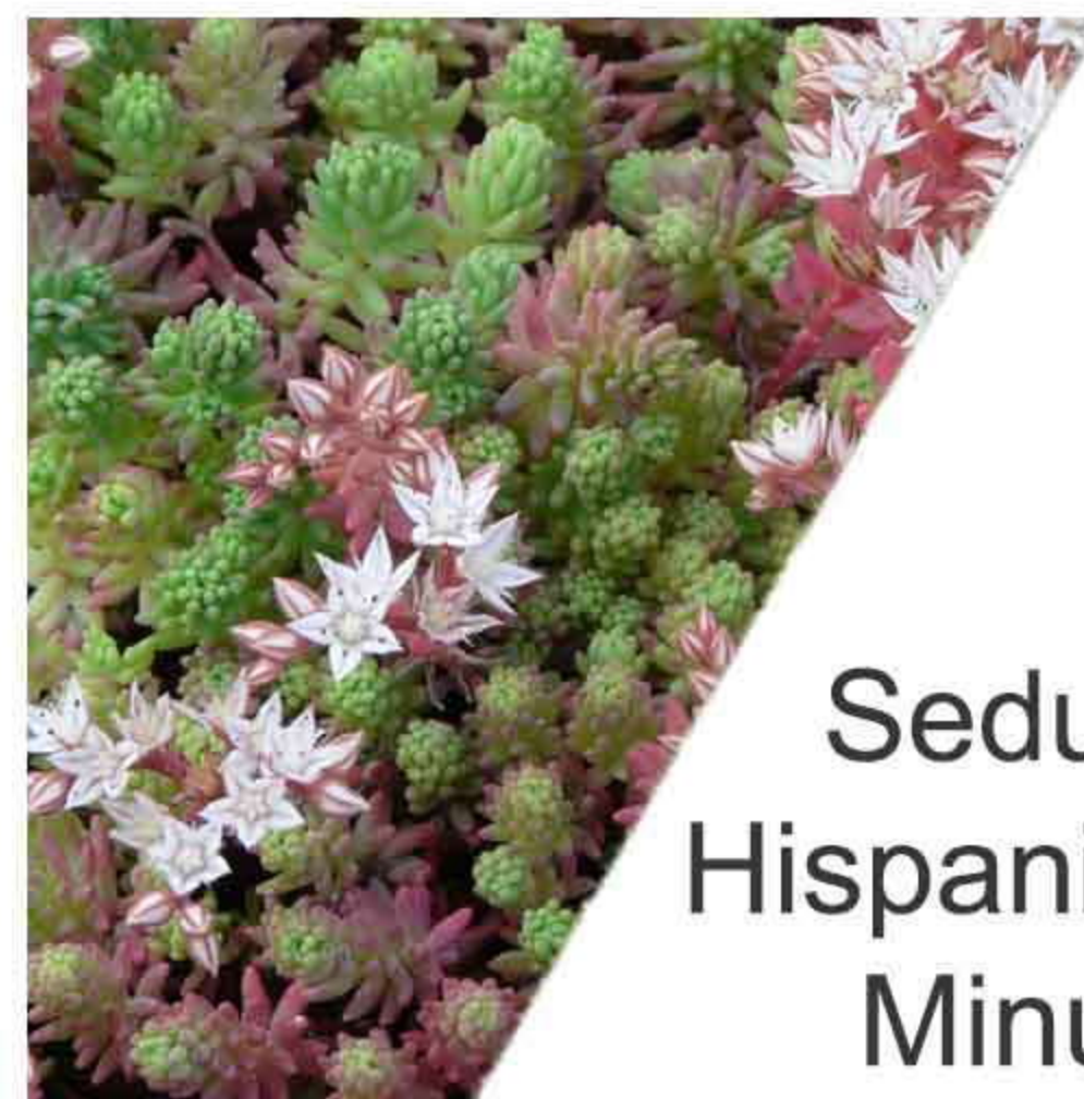
Sedum Hispanicum Minus