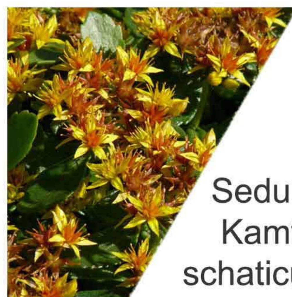
Sedum Kamt- schaticum