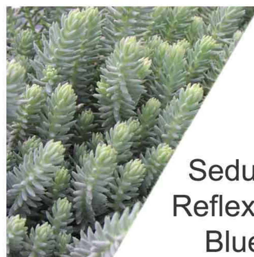
Sedum Reflexum Blue