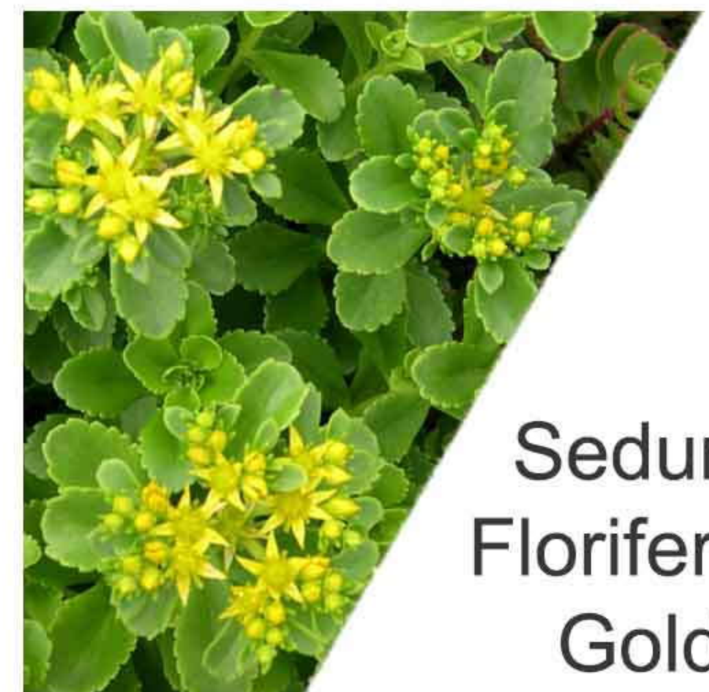
Sedum Floriferum Gold