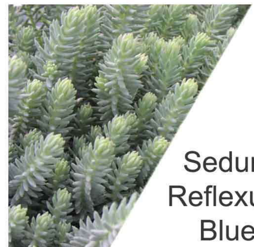
Sedum Reflexum Blue