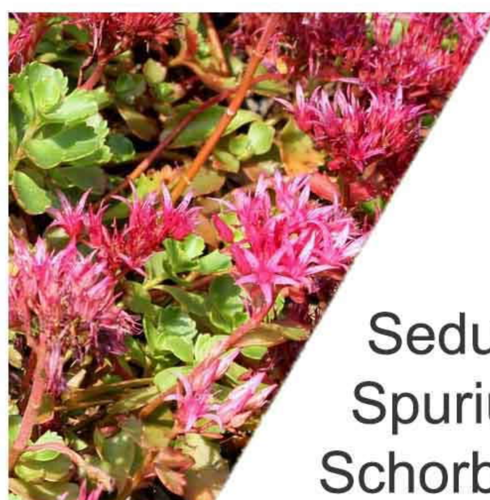
Sedum Spurium Schorbuser