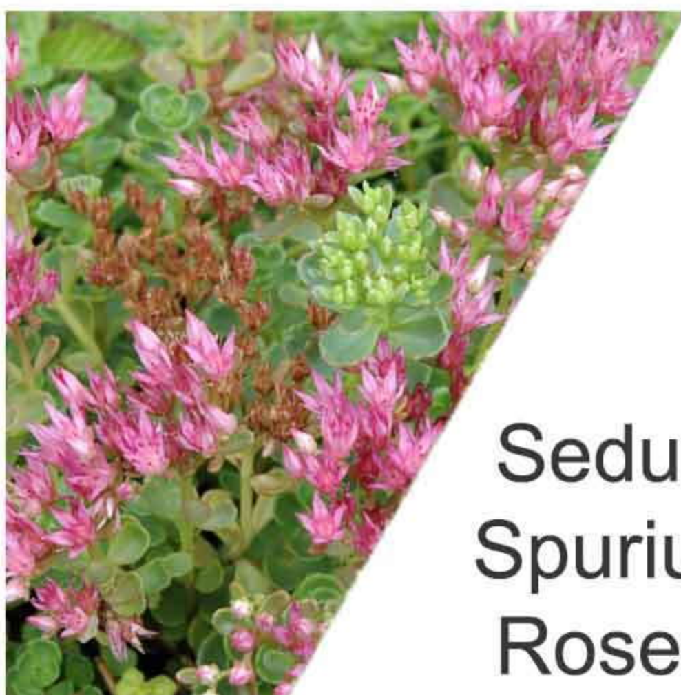
Sedum Spurium Rosea