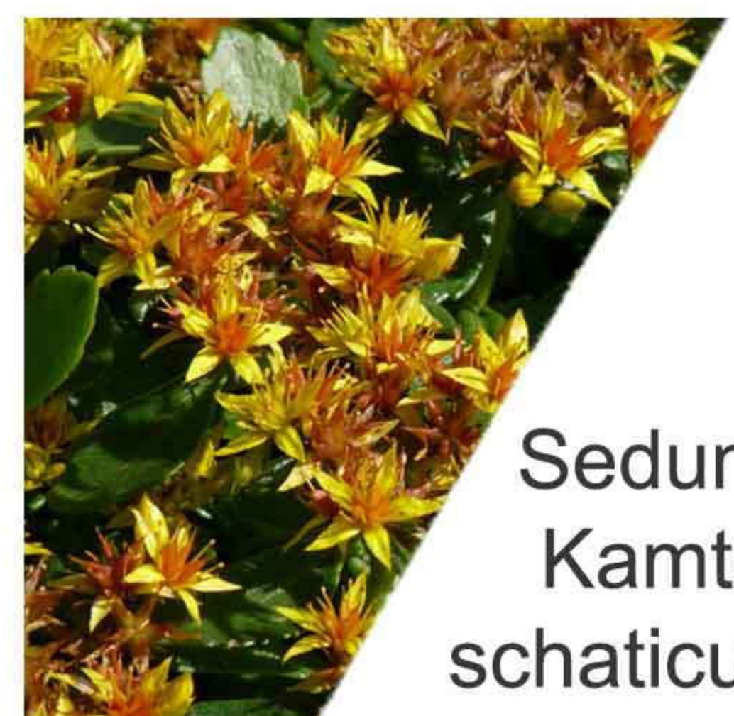
Sedum Kamt- schaticum