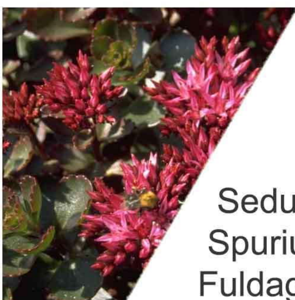
Sedum Spurium Fuldaglut