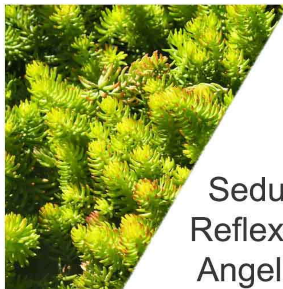
Sedum Reflexum Angelina