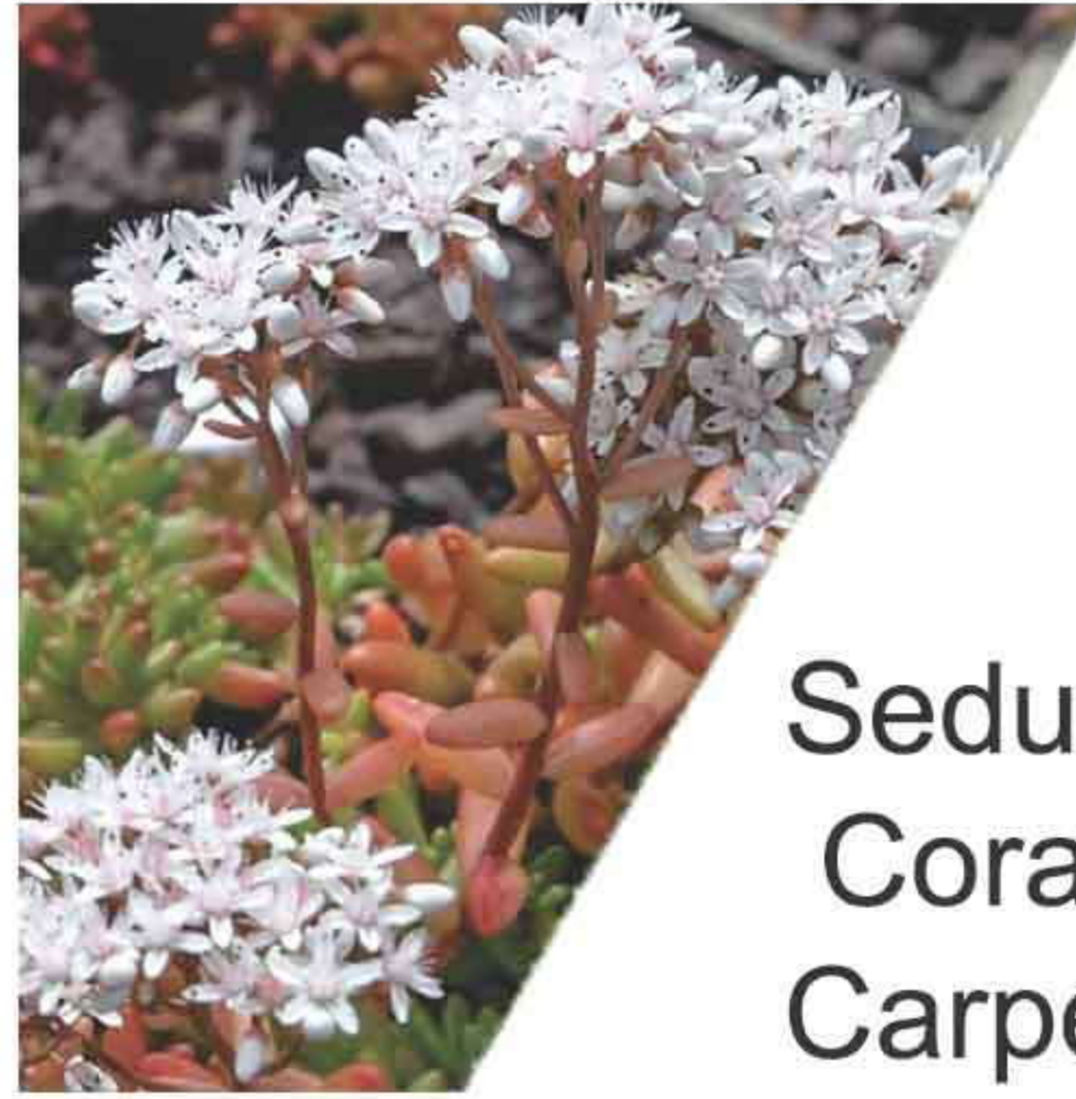
Sedum Coral Carpet