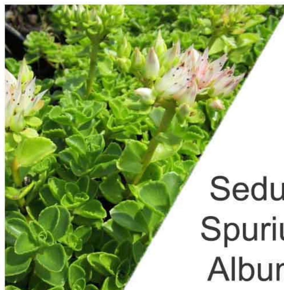
Sedum Spurium Album