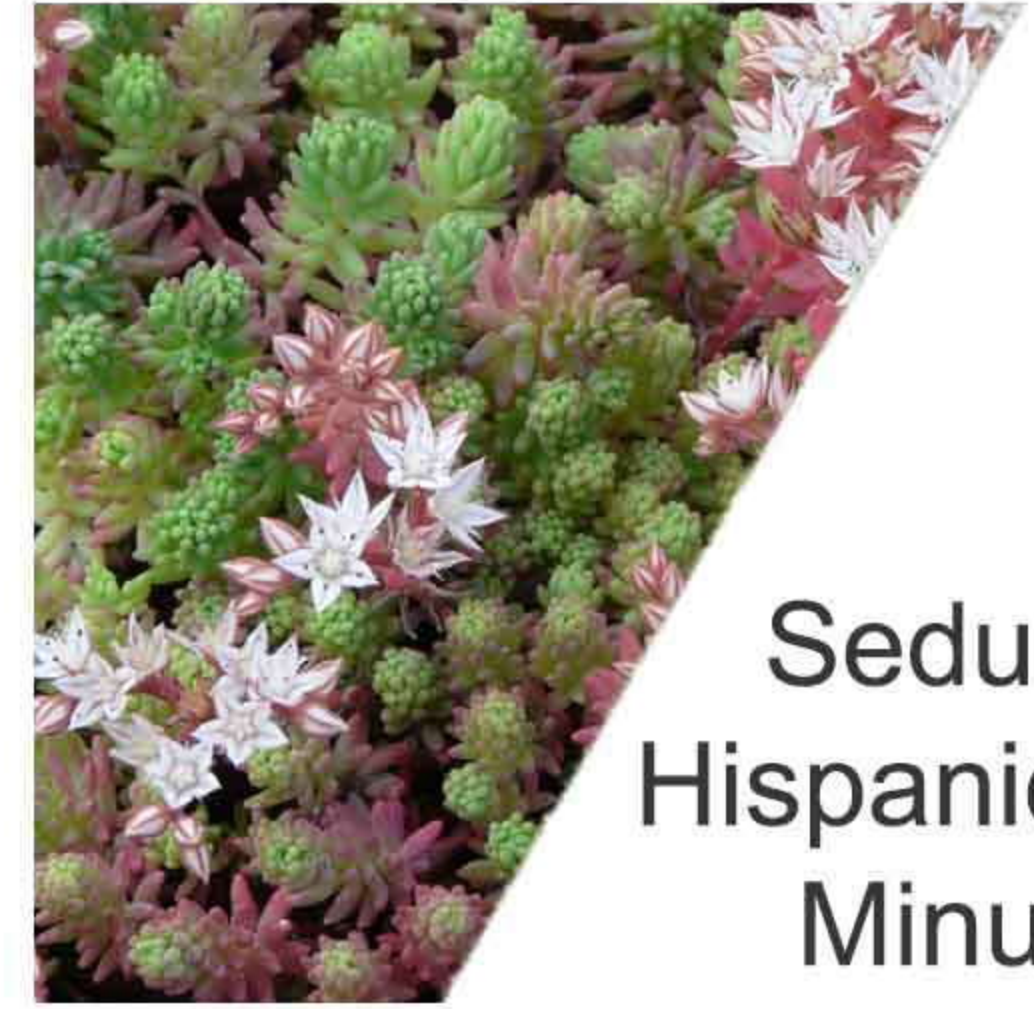
Sedum Hispanicum Minus